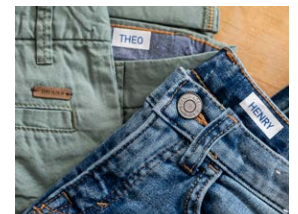
Stoftape – til påstrygning