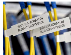
FLe-tape til kabelflag