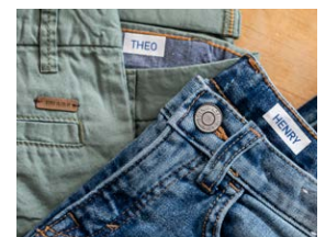
Stoftape – til påstrygning