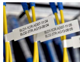
FLe-tape til kabelflag